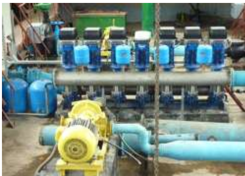
Бориспільський водоканал оновив своє обладнання за коштів позики Світового банку.

водопостачальним комунальним підприємствам – учасникам у сфері розбудови інституційного потенціалу. Це забезпечить кращий доступ до послуг водопостачання, водовідведення та утилізації твердих відходів для понад 6 мільйонів громадян. Проект також містить адресну допомогу в розмірі 50 млн. дол. США від Фонду чистих технологій.