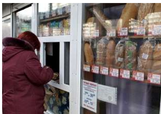
Жінка купує хліб у Дніпропетровську

стратегічних заходів, метою яких є посилення правового, операційного та фінансового потенціалу ФГВ, покращення платоспроможності банків та, загалом, перетворення банківської системи у більш ефективну систему, здатну витримати можливі майбутні потрясіння. Планується, що друга операція підтримає подальші реформи у цих трьох широких сферах, і надання позики очікується у третьому кварталі 2015 фінансового року. Програмна багато секторальна фінансова системна та інституційна Позика на політику розвитку для проведення реформ включає реформи для покращення бізнес середовища, а також макроекономічні і інші реформи в середині політичної матриці. У травні 2014 року було виділено 750 млн. дол. США, у той час, коли друга позика на даний час знаходиться на етапі підготовки.