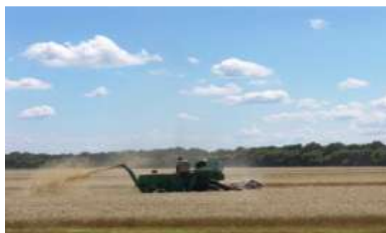
Сільськогосподарські роботи в Полтавській області

Україна має величезний сільськогосподарський потенціал і здатна відігравати дуже важливу роль у зміцненні глобальної продовольчої безпеки. У 2012 році частка сільського господарства у загальній цифрі ВВП країни зросла до 9,3 відсотки та склала 17,2 відсотки від загального рівня зайнятості та 26% від національного експорту. Проте, цей потенціал використовується неповною мірою внаслідок стримування доходів фермерських господарств і невідповідної політики, яка призвела до зменшення приватних інвестицій нижче від рівнів, потрібних для модернізації сектору.