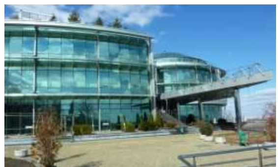
Представництво Групи Світового банку в Україні (м. Київ)

Стабілізація банківського сектору передбачає розширення Програми фінансування глобальної торгівлі з метою полегшення торгівлі та, можливо, підтримки капіталізації і ліквідності низки банків. Триватиме інвестиційна і дорадча робота з проблемними активами і непрацюючими позиками. У більш довгостроковій перспективі МФК надаватиме через комерційні банки цільове фінансування малим і середнім підприємствам на реалізацію заходів з підвищення енергоефективності в секторі агробізнесу.