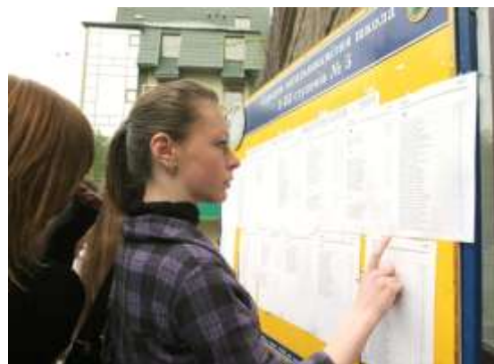
Старшокласники перевіряють свої результати тестів у Харкові.

Після закриття Проекту рівного доступу до якісної освіти у 2010 році Світовий банк й надалі підтримував діалог з Урядом України щодо політики оптимізації і підвищення ефективності системи освіти в контексті Програми економічних реформ. Висновки нещодавнього дослідження Світового банку “Чи є оптимізація слушною можливістю?: Оцінка впливу розміру класу і школи на результати навчання в загальноосвітніх навчальних закладах” свідчать про те, що більші загальноосвітні школи в Україні, як правило, мають трохи кращі результати тестових оцінок та участі в тестах, але розмір класів практично не має значення. Отже, малоімовірно, що оптимізація мережі загальноосвітніх шкіл негативно вплине на якість навчання, якщо забезпечити належний доступ. Ще один вид допомоги - Ініціатива Світового банку BOOST з Аналізу бази даних державних видатків , спрямована на підвищення ефективності шляхом покращення відкритості інформації про державні витрати у сфері освіти та зміцнення спроможності органів державного управління у сфері аналізу державних видатків.