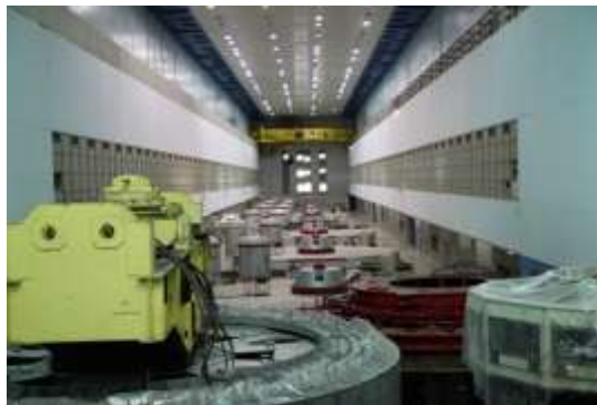
Оновлені гідроагрегати на Дніпровській гідроелектростанції.

років впровадження цього проекту було здійснено реабілітацію 59 гідроагрегатів на шести гідроелектростанціях, а встановлену потужність реабілітованих гідроелектростанцій збільшено приблизно на 156 МВт станом на серпень 2014 р. Цей проект був також піонерським у впровадженні концепції вуглецевого фінансування в Україні, оскільки він був першим Проектом спільного впровадження у рамках Кіотського протоколу в Україні.