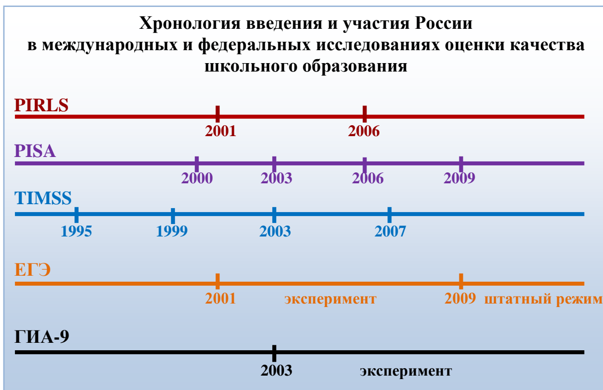
Рис. 2. Хронология введения в России независимой оценки качества образования