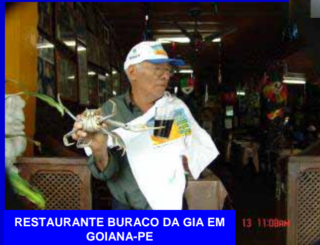
RESTAURANTE BURACO DA GIA EM GOIANA-PE