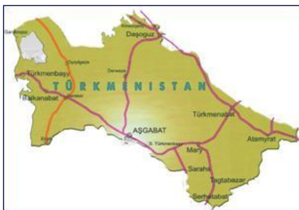
Карта железнодорожной сети Туркменистана

менбаши, включая общие грузовые терминалы, рельсовый паром, и нефтяные причалы. Маршрут рельсового парома – главным образом дальний фрахт из Европы/Северной Америки через Грузию и Азербайджан в Ашхабад и страны транзита (Узбекистан и Афганистан). Государственная служба морского и речного транспорта Туркменистана (ГСМРТТ) при Кабинете Министров отвечает за политику, регулирование и управление морским сектором Туркменистана. Международный морской порт Туркменбаши (ММПТ) является подведомственной структурой ГСМРТТ и отвечает за операции в порту.